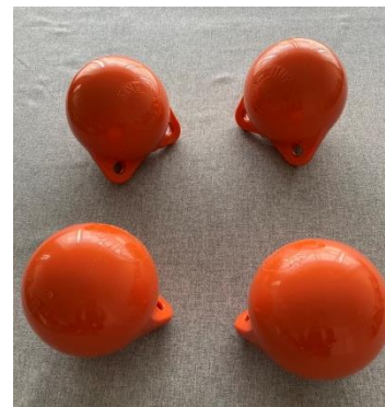
直径 10cm（4個セット） 価格：297,000円（税込）

活性エネルギー電位は、標高3万m以上の振動波を持ち、その影響範囲は、1カ所の設置で上空・地下の10km~100km四方にまで及びます。